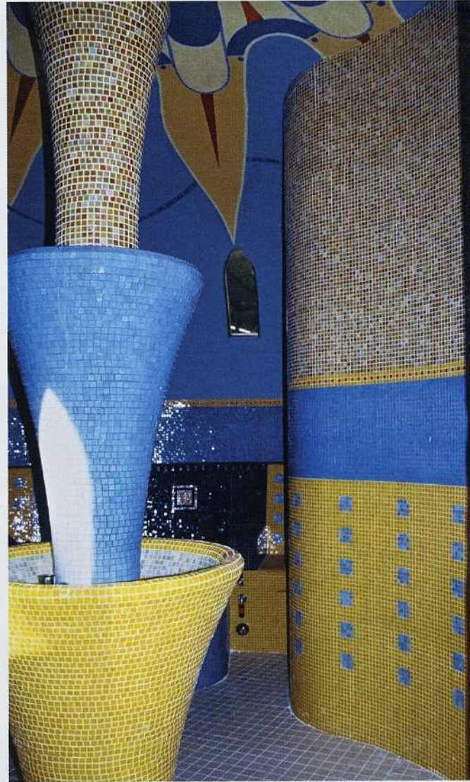
Der Mittelpfeiler aus Edelstahl wurde mit zwei speziell gefertigten Lux-Elements-Concept-Teilen maßgeschneidert verkleidet

geschneiderte Sonderlösungen für individuelle Objekte in der ganzen Welt.“ In enger Zusammenarbeit zwischen Auftraggeber und Lux Elements France wurde das Projekt kalkuliert.