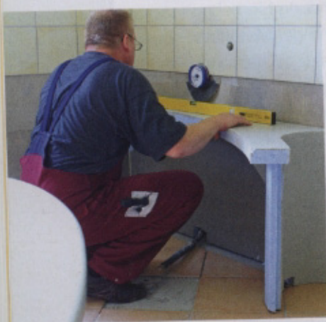
Der Handwerker richtet die vorgefertigten Teile mit der Wasserwaage aus.