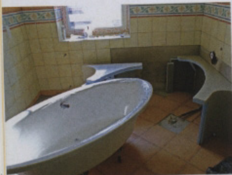
Die ellipsenförmige Badewanne wurde aus einer Ecke heraus in den Raum hinein gebaut.

Bäder Plaza löste die Aufgabe mit vorgefertigten Hartschaum-Trägerelementen der Produktlinie Lux Elements-Top. Diese umfasst Verkleidungen für Badewannen und Whirlpools aus Stahl und Kunststoff in verschiedenen Formaten und Einbausituationen. Beim Einbau von Revisionsöffnungen kann dabei zwischen zwei unterschied-