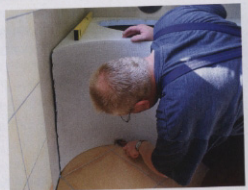
Die Höheneinstellung der Verkleidungselemente erfolgt mit Hilfe der eingebauten Stellfüße.