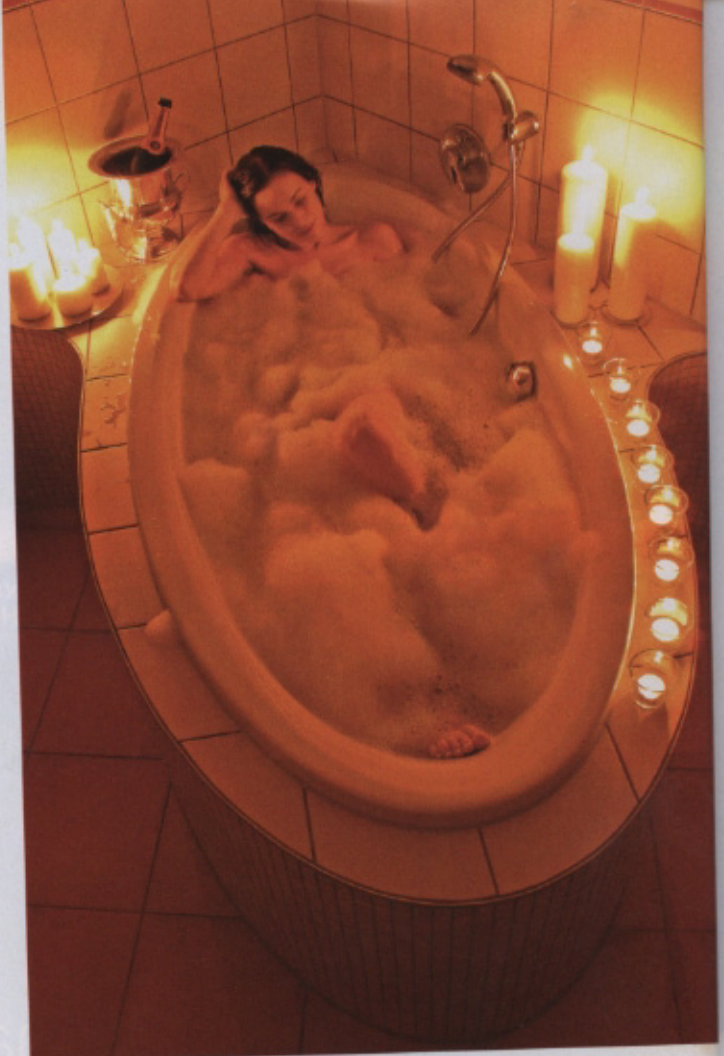
Wellness-Oase statt Nasszelle: Das moderne Bad wird immer wohllicher.

In Neustadt/Rübenberg richtete eine Familie ihr Bad mit Hartschaum-Trägerelementen von Lux Elements neu ein. Zentrales Gestaltungselement des circa 13 m 2 großen Raumes ist die ellipsenförmige Badewanne, die aus einer Ecke heraus in voller Länge in den Raum hinein gebaut wurde. Der Installateur sollte eine maßgeschneiderte Verkleidung mit kombi-